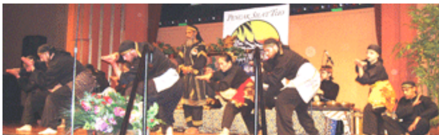
Acaranya "Secrets of the Heart II" di Rackham di 2004.