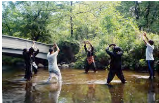
Latihan di sungai di Ann Arbor.