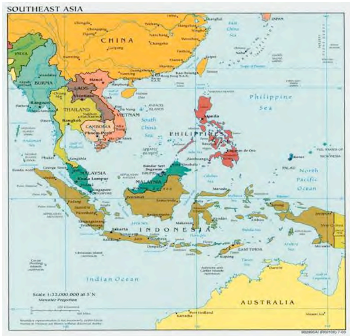
Peta di Asia Tenggara.

Ada banyak variasi di silat. Banyak seni bela diri lain asalnya yang silat tuo, seni bela diri negeri Pilipina tradisional asalnya silat. Kepulauan Melayu punya banyak variasi silat, seperti Silat Seni Gayong . Ada banyak variasi silat dari Jawa juga. Pencak